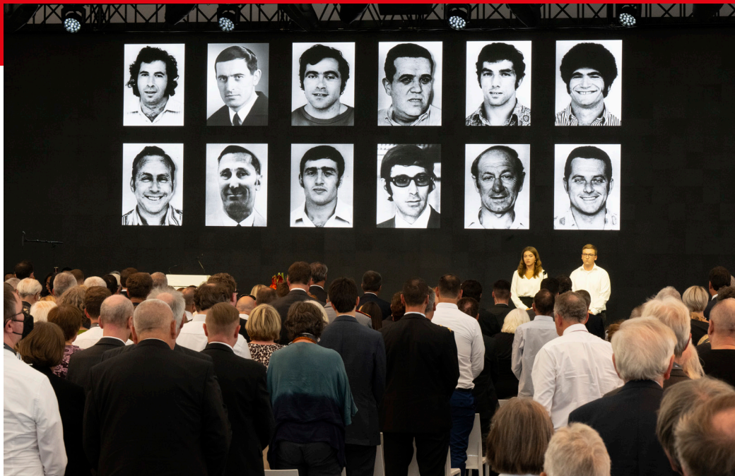
Abbildung: Gedenken am 50. Jahrestag des Attentats im September 2022.

denn sie wurden im Zuge einer Flugzeugentführung am 29. Oktober 1972 freigelassen. Somit bleiben die Morde bis heute ungesühnt.