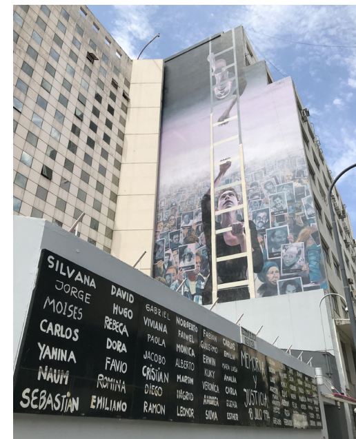
Abbildung: Gedenktafel am Ort des Anschlags in Buenos Aires.

Vor einer Synagoge und in unmittelbarer Nähe eines jüdischen Pflegeheims in Kopenhagen explodierte im Sommer 1985 eine Bombe, die jedoch niemanden ernsthaft verletzte. Eine zweite Bombe detonierte vor dem Büro der amerikanischen Airline Northwest Orient, wobei ein Passant tödlich verwundet und 26 weitere Personen verletzt wurden. Zusätzlich wurde eine dritte Bombe in einer Tasche vor dem Büro der israelischen Fluggesellschaft El Al platziert, allerdings kurzerhand vom Täter entschärft und in einem Kanal entsorgt, nachdem dieser sich offenbar umentschieden hatte. Der Anschlag wird der Palestinian Popular Struggle Front (PPSF) zugerechnet und lässt sich dem nationalistisch-palästinensischen Spektrum zuordnen.