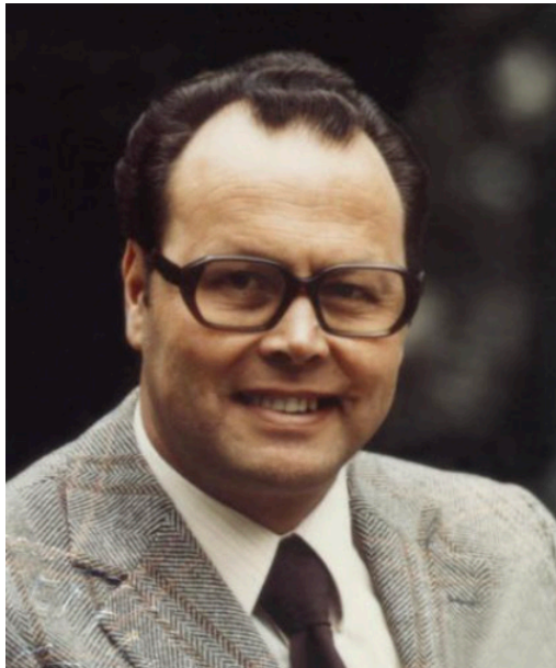
Abbildung: Heinz Nittel.

Heinz Nittel wurde 1930 geboren und war Politiker der Sozialdemokratischen Partei Österreichs (SPÖ), für die er ab 1970 im Nationalrat und ab 1976 im Wiener Stadtrat Mandate übernahm. Zudem war er als Präsident der Österreichisch-Israelischen Gesellschaft tätig. Auf dem Weg zur Wiener Maifeier wurde Nittel 1981 im Dienstwagen, der vor seiner Wohnung gehalten hatte, erschossen. Der Täter war von der Abu-Nidal-Organisation, einer Abspaltung der Palestine Liberation Organisation (PLO), mit dem Mord beauftragt worden. In seinem Geständnis gab er an, zionistische Ziele treffen zu wollen. Zum Gedenken sind heute in Wien eine Straße und eine Wohnsiedlung, in Jerusalem ein Verkehrszentrum nach Heinz Nittel benannt.