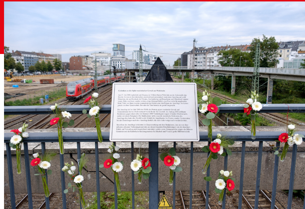
Abbildung: Die Gedenktafel am Vinzenzplatz.

Seit 2020, erst 20 Jahre nach der Tat, existiert eine Gedenktafel. Auf der Tafel steht, es war „ein heimtückischer, rassistisch und antisemitisch motivierter Anschlag auf zwölf Menschen“. Die Gedenktafel wird immer wieder geschändet. Im selben Jahr fand die erste Gedenkveranstaltung statt. Mit Wehrhahn erinnern ist eine lokale Gedenkinitiative entstanden, die sich für den Erhalt des Gedenkortes und die Erinnerung des Anschlags einsetzt.