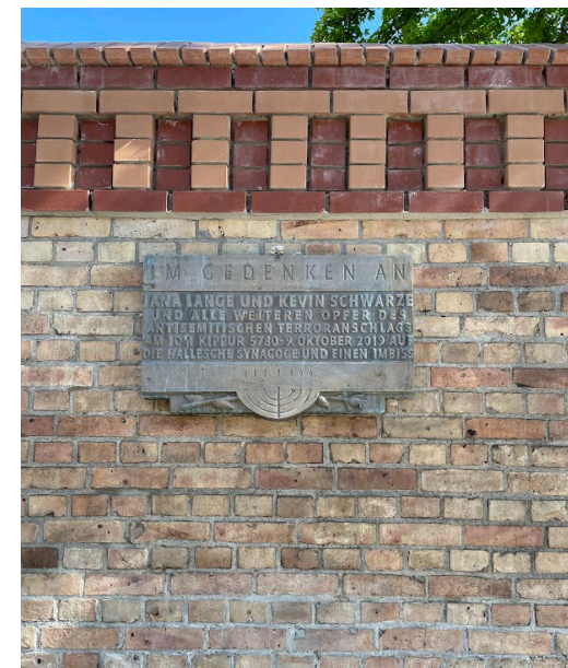
Die Gedenktafel in Halle (Saale).

Das Gericht stellte die besondere Schwere der Schuld fest und ordnete die Sicherungsverwahrung des Täters an. Das Buch Der Halle-Prozess: Mitschriften (2021) dokumentiert die einzelnen Verhandlungstage. An die Protokolle schließt das Buch Der Halle-Prozess: Hintergründe und Perspektiven (2022) an.