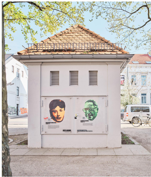
Der Gedenkavillon in Bremen